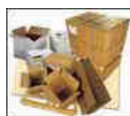
Papier / Carton