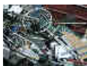
Ferraille et métaux