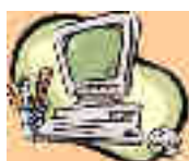
Réfrigérateurs, matériel informatique, T.V. (déchets d'Équipement Électriques et Électroniques)